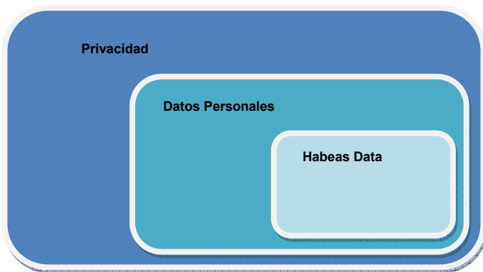
Figura 2.. Relación entre Privacidad, Protección de Datos y Habeas Data

Toda persona podrá interponer esta acción para tomar conocimiento de los datos a ella referidos y de su finalidad, que consten en registros o bancos de datos públicos, o los privados destinados a proveer informes, y en caso de falsedad o discriminación, para exigir la supresión, rectificación, confidencialidad o actualización de aquellos. No podrá afectarse el secreto de las fuentes de información periodística.