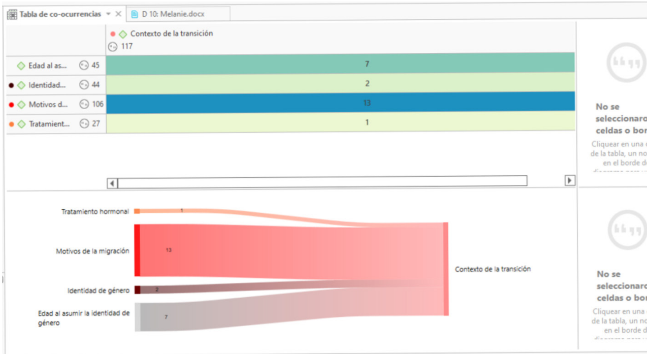
Tabla N°2. Tablas de co-ocurrencias y diagrama Sankey