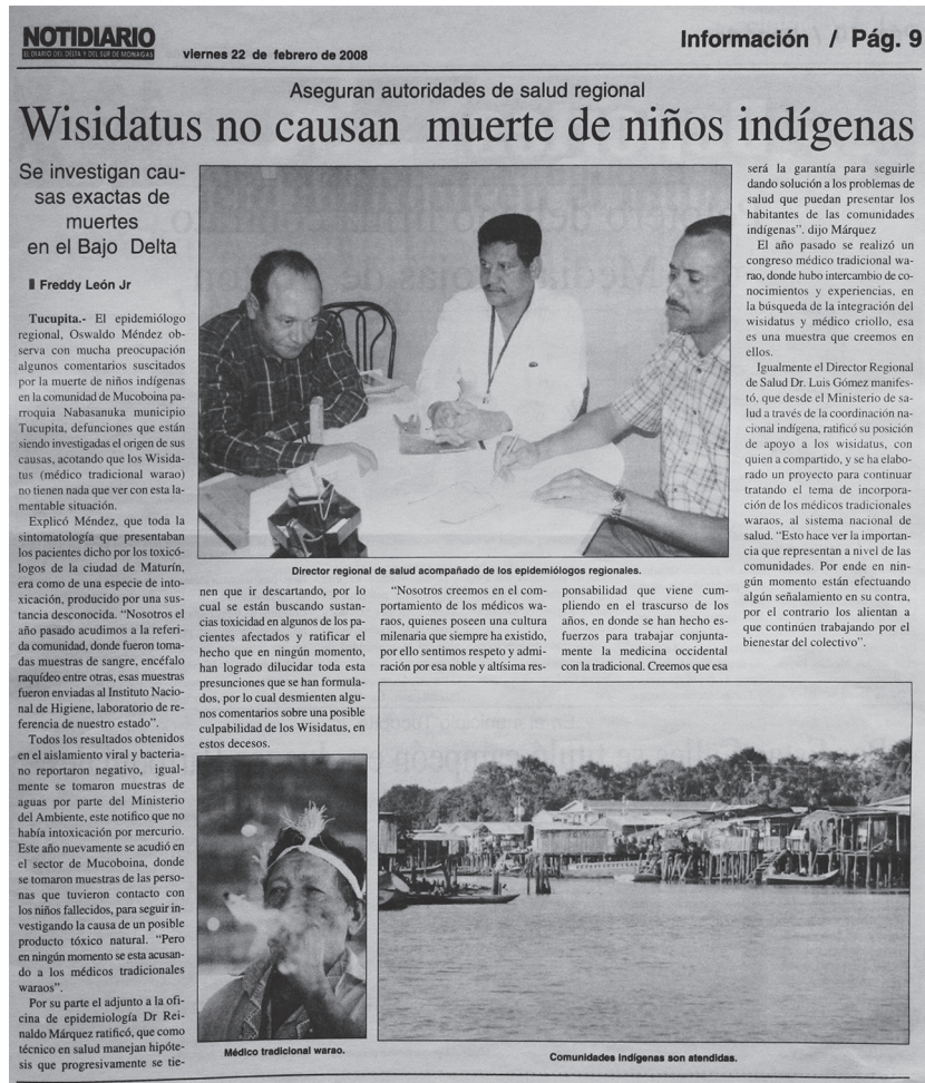
Figura 3. Nota de prensa sobre la epidemia. Delta Amacuro, Venezuela; 2008.

obtener respuestas. Ni los relatos mediáticos ni los informes oficiales mencionan, sin embargo, la extraña epidemia y se enfocan, en cambio, en las enfermedades diarreicas. En vez de escuchar las observaciones y preocupaciones de la población, los esfuerzos epidemiológicos incluyeron "una serie de actividades educativas, realizando visitas casa por casa", que en el informe se especifica que consistieron en "charlas a las comunidades sobre el manejo del agua y el saneamiento ambiental" (18) . La política, la investigación y la intervención se dirigieron su argumentación a la prensa, que acompañó las actividades para atestiguar el entusiasmo de la viceministra del Ministerio de Poder Popular para la Salud, "quien estuvo inspeccionando personalmente las actividades realizadas por este grupo de trabajo multidisciplinario" (17) .