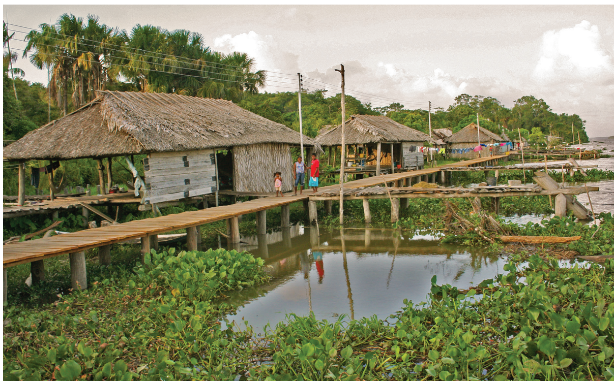
Figura 1. Pueblo Mukoboina, Delta Amacuro, Venezuela. 2007.

motorizadas, aceite y gasolina, dado que los derivaron al hospital de la capital del estado donde, a su vez, los derivaron a unidades de terapia intensiva y a especialistas en áreas metropolitanas; sin embargo, todas las criaturas volvieron en ataúd.