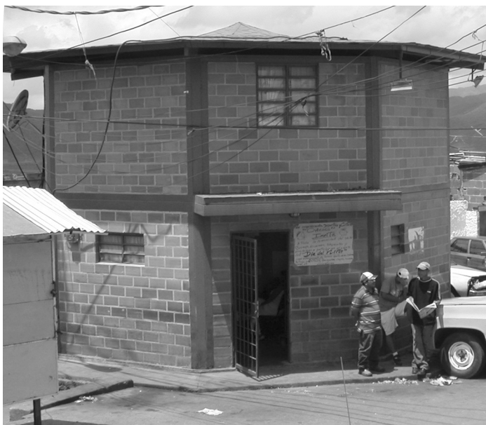
Figura 3. CONSULTORIO POPULAR CONSTRUIDO PARA LA MISIÓN BARRIO ADENTRO I.