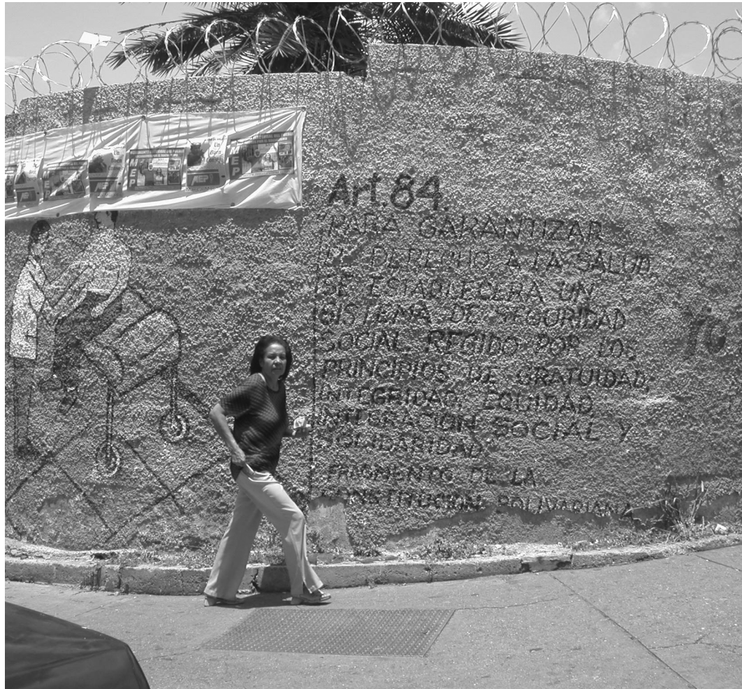
Figura 1. MURO EXTERIOR EN EL BARRIO 23 DE ENERO, CON EL ARTÍCULO 84 DE LA CONSTITUCIÓN BOLIVARIANA DE VENEZUELA.