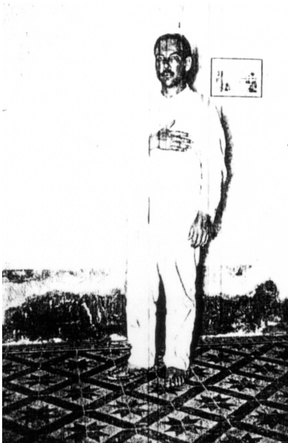
Figura 1. MANO SANTA. FOTO TOMADA EN EL INTERIOR DE UNA FINCA DE JUJUY NO IDENTIFICADA, EN LOS DÍAS DE SU ESTADÍA EN SAN SALVADOR.