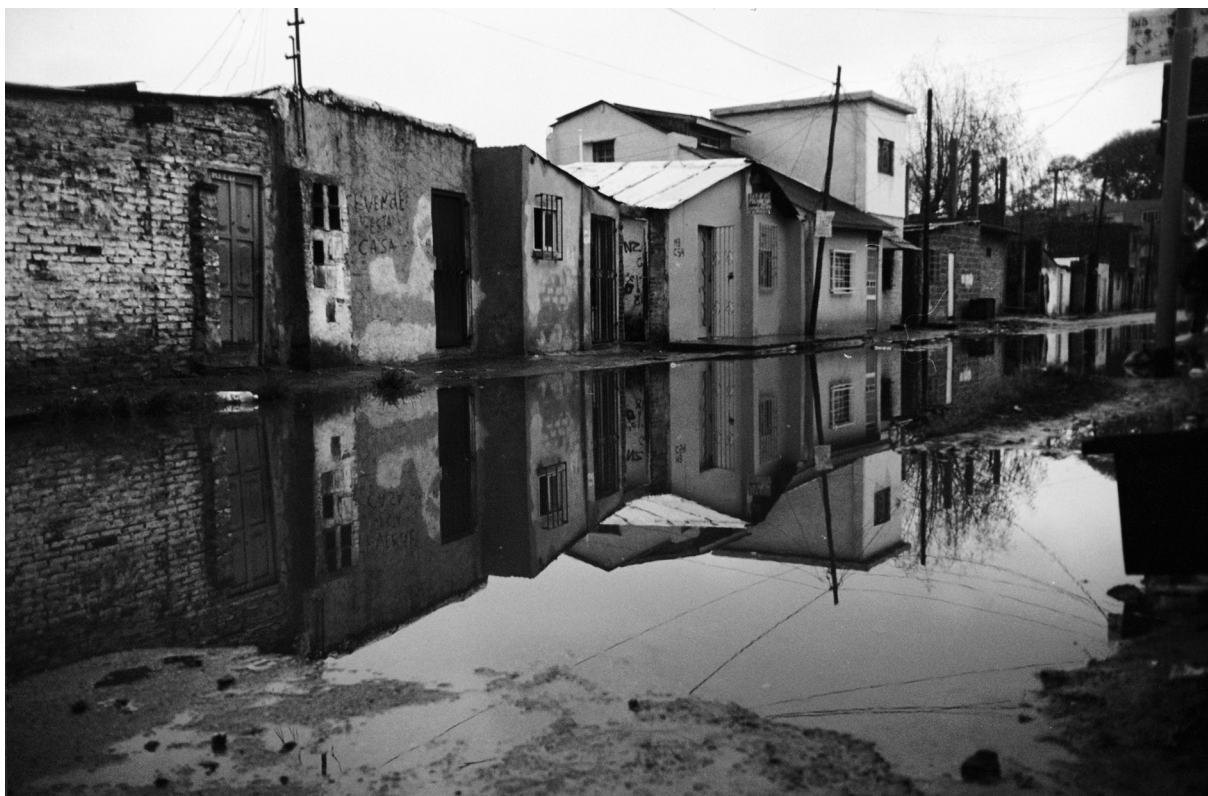
Figura 1. FOTOGRAFÍA DE CIUDAD OCULTA TOMADA POR NATALIA GODOY. PROYECTO PH15. CIUDAD OCULTA, ARGENTINA

Nota: reproducido con la autorización de los autores y del Proyecto ph15©.