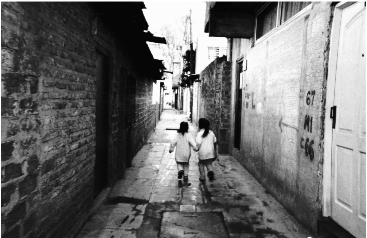
Figura 2. FOTOGRAFÍA DE CIUDAD OCULTA TOMADA POR NANCI ALFONSO. PROYECTO PH15. CIUDAD OCULTA, ARGENTINA

Nota: reproducido con la autorización de los autores y del Proyecto ph15©.