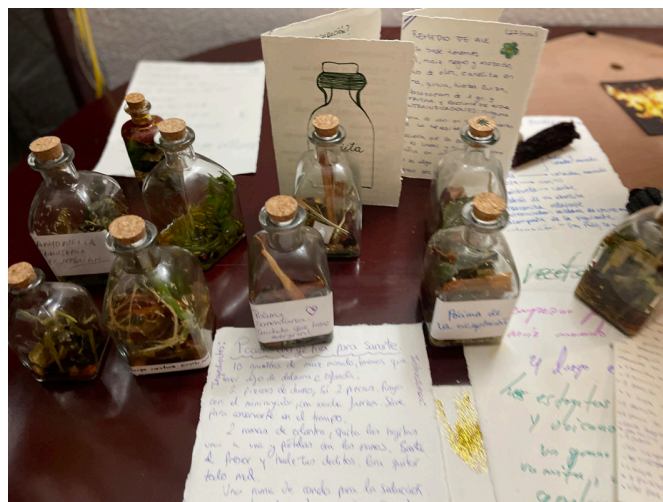
Figura 1. Pócimas anticoloniales.