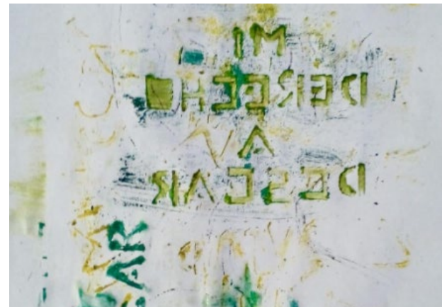
Imagen 3. “Todo esto Somos”. Acciones de estampado en espacios públicos. (2022/2023)