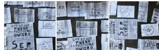
Imagen 4. “Todo esto Somos”. Acciones de estampado en espacios públicos. (2022/2023)