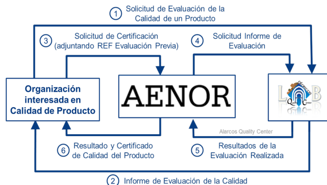
Fig. 4. Ciclo de Evaluación y Certificación del Producto Software

Como resultado se creó un procedimiento que, a partir del informe del laboratorio acreditado y tras una auditoría por parte de AENOR, permitía certificar la calidad del producto software bajo estudio realizando los siguientes pasos (Fig. 4):