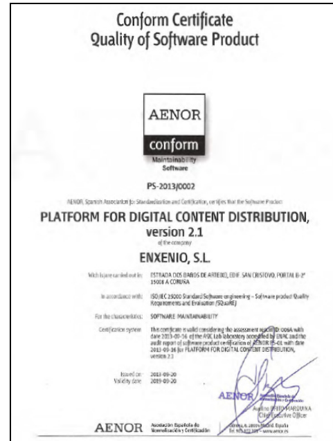
Fig. 6. Ciclo de Evaluación y Certificación del Producto Software

La calidad del producto software es una de las principales preocupaciones tanto para las empresas desarrolladoras, como para los organismos que lo adquieren. El presente artículo ha presentado una solución, formada por un ecosistema completo, que permiten realizar la evaluación del producto software y alcanzar posteriormente una certificación de calidad. Además, para mostrar la aplicación práctica de la evaluación y certificación de la calidad del producto software, se han presentado también los detalles de un proyecto piloto de evaluación y certificación realizado, con los datos concretos obtenidos por una de las empresas participantes en dicho proyecto.