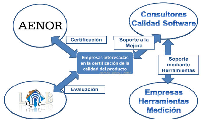
Fig. 3. Modelo de calidad del producto software según la ISO/IEC 25010

empresas desarrolladoras de software (de cualquier dominio), como entidades que han externalizado sus desarrollos o directamente adquieren un producto software, independientemente del propósito del mismo. Esta entidad es el elemento central del ecosistema y su interés por la calidad del producto es el que motiva precisamente la evaluación y certificación del mismo.