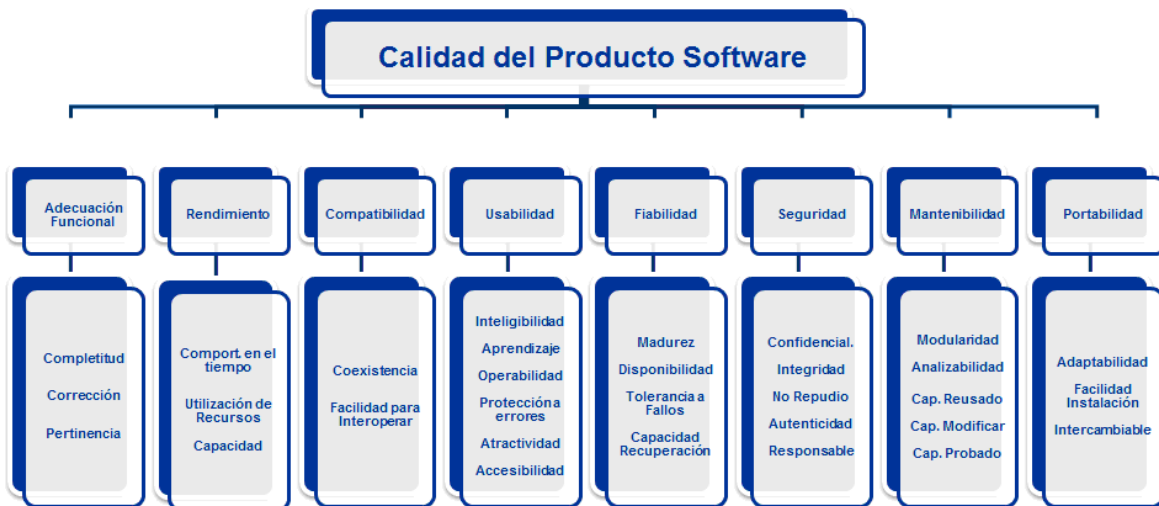
Fig. 2. Modelo de calidad del producto software según la ISO/IEC 25010

funcionalidad, rendimiento, compatibilidad, usabilidad, fiabilidad, seguridad, mantenibilidad y portabilidad. Esta parte de la norma representa por tanto el espejo frente al cual podemos mirar la calidad de nuestro producto software.